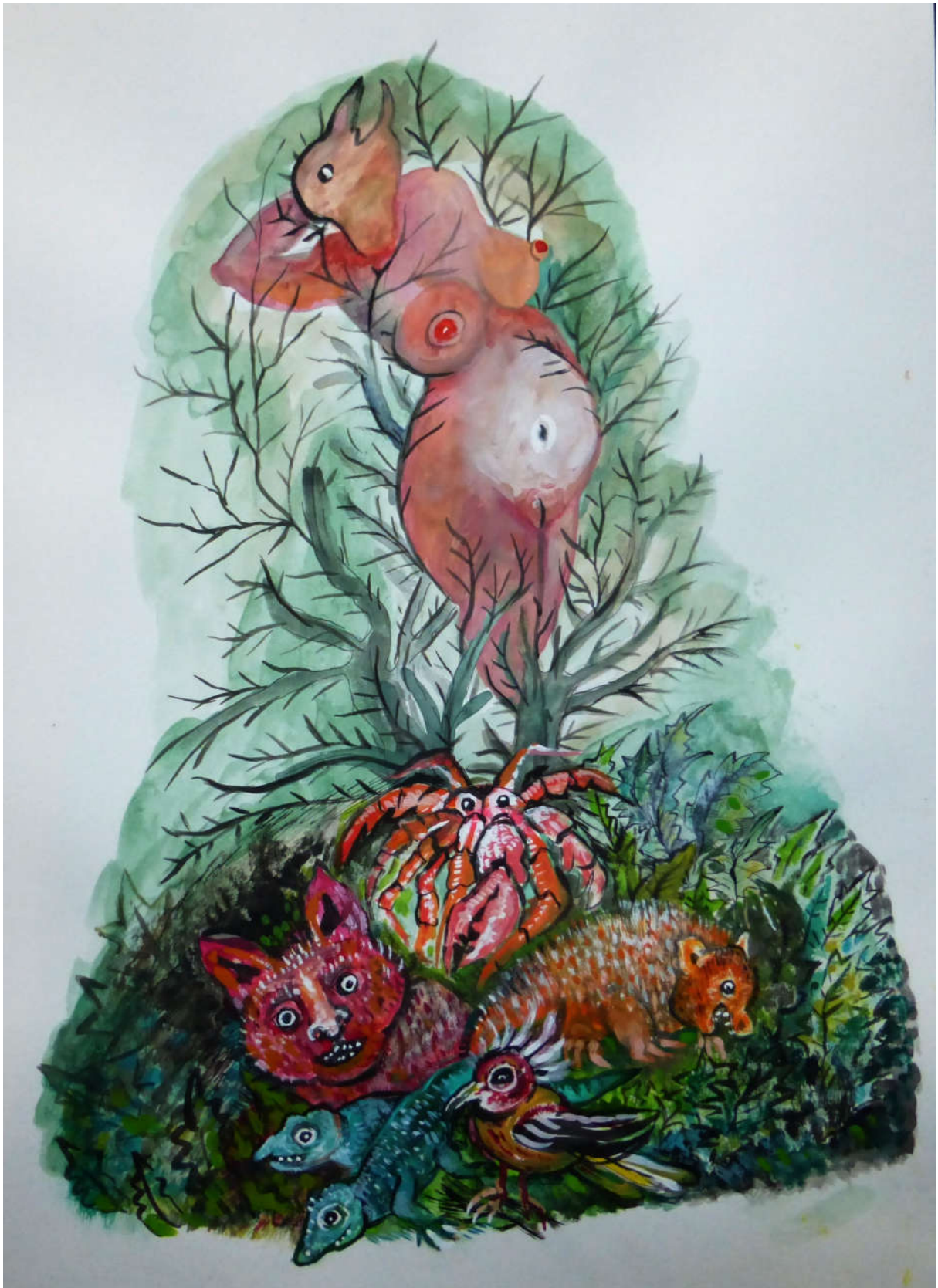
Irene Klaffke: Amintire (2019). Mischtechnik.