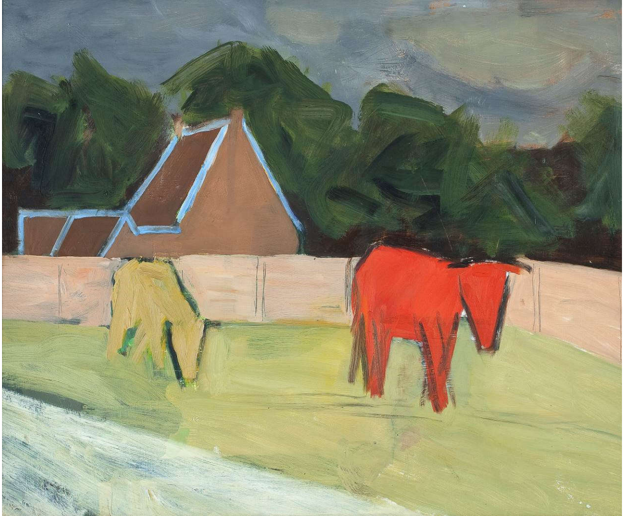
Roger Raveel: Rode koe (wahrscheinlich um 1948). Öl auf Leinwand, auf Sperrholz verklebt.