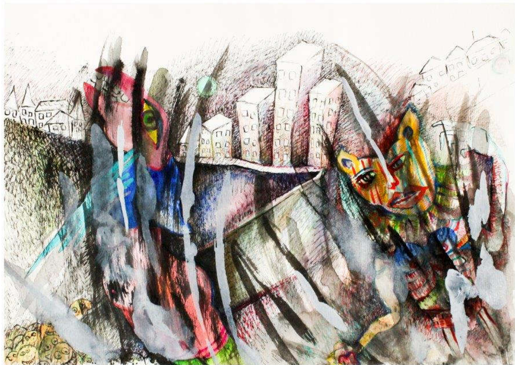
Irene Klaffke: Im Gestrüpp vor der Stadt (2012). Colorierte Federzeichnung.