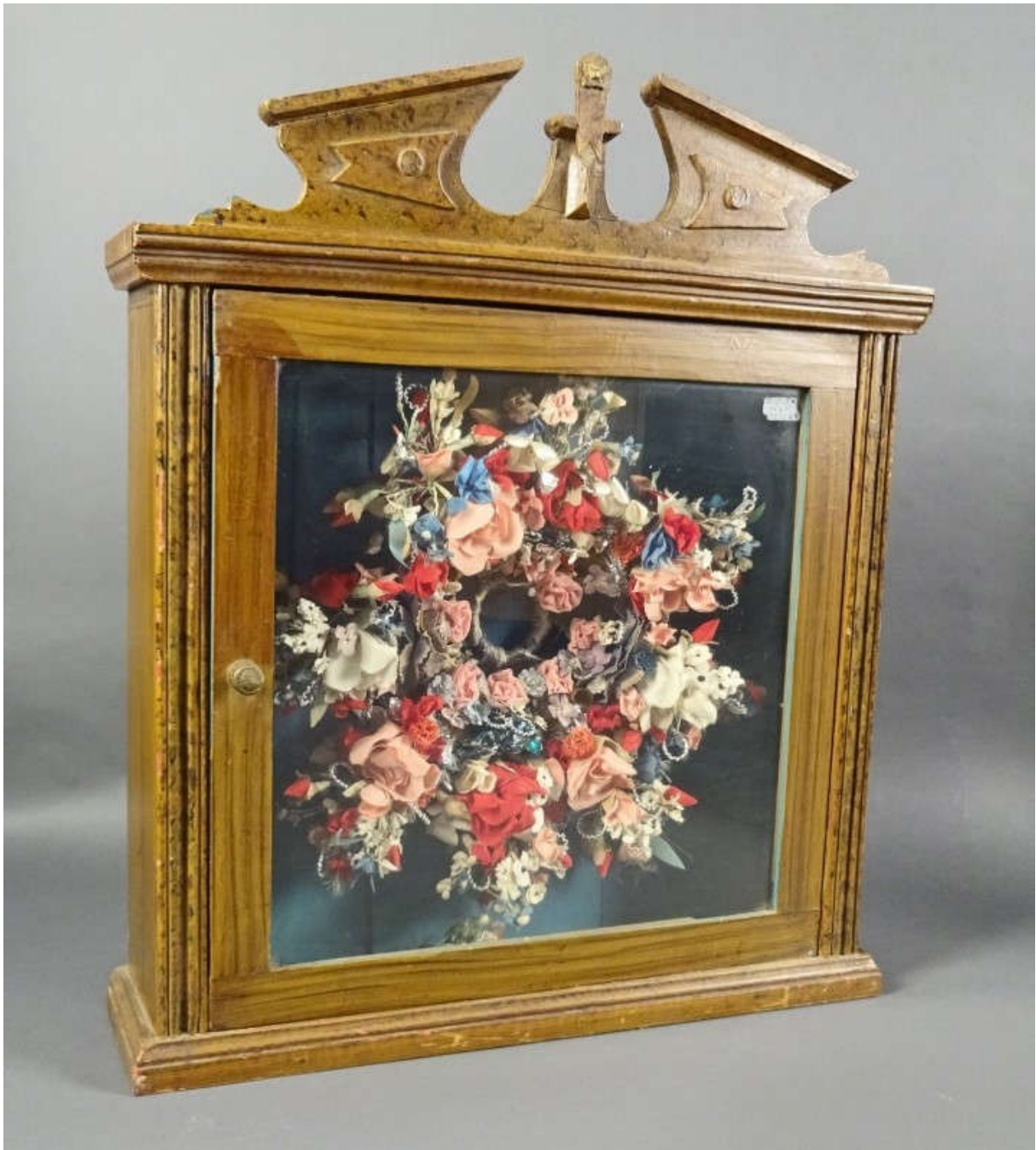
Siebenbürgischer Brautkranz, gerahmt (um 1880?).

War das also nicht schon in der Habsburgermonarchie so oder in der Zwischenkriegszeit?