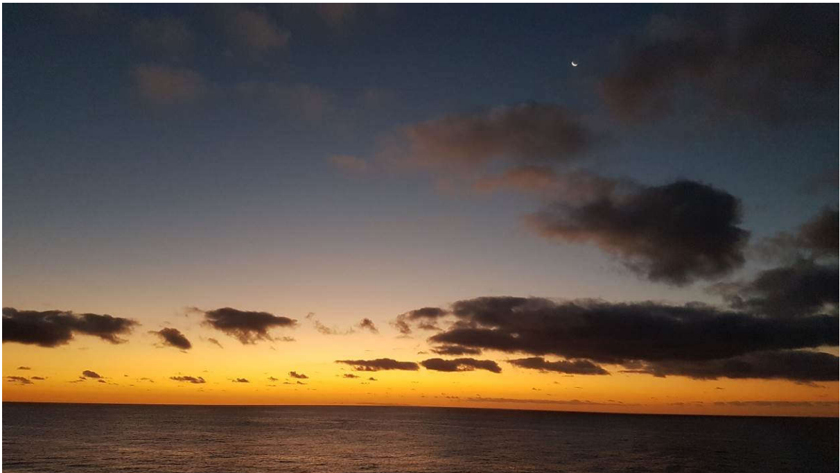
In der Kalmenzone vor Westafrika: 01^{\circ}14.7'S , 012^{\circ}41.5'W .