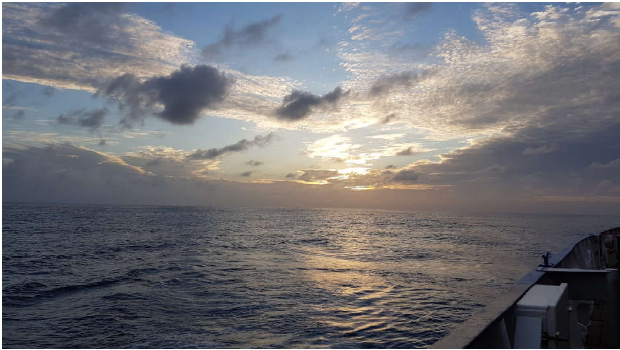
In der Kalmenzone vor Westafrika: 04°32.8'N, 021°50.2'W.

Mitteln.“ Für Jean Paul gelte, wie für Shakespeare und das Barockdrama, „der Traum ist in der Regel, vermittelt durch die ihm eigenen Gesetze der Bildverknüpfung, Allusion und Erzähllogik, nicht nur poetischer Stoff, sondern zugleich dichterisches Prinzip. Bei Jean Paul tritt nun zur ästhetischen Funktion des Traums eine metaphysische Bedeutungsebene, die man in dieser Form weder bei Wieland und Lessing noch bei Diderot und Goethe antreffen konnte.“ 8