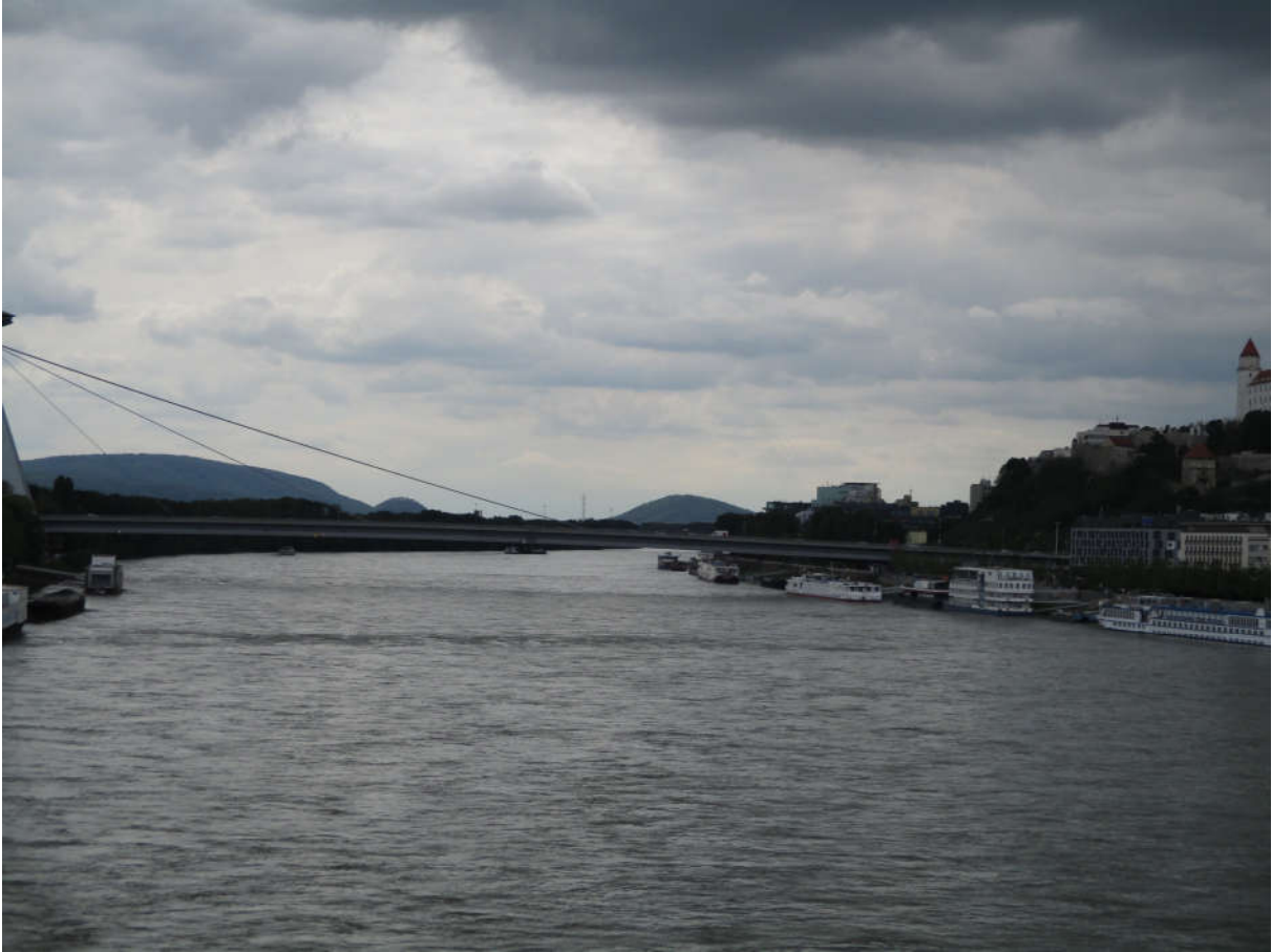
Ein Teil der Kleinen Karpaten, von Bratislava aus gesehen (April 2019).