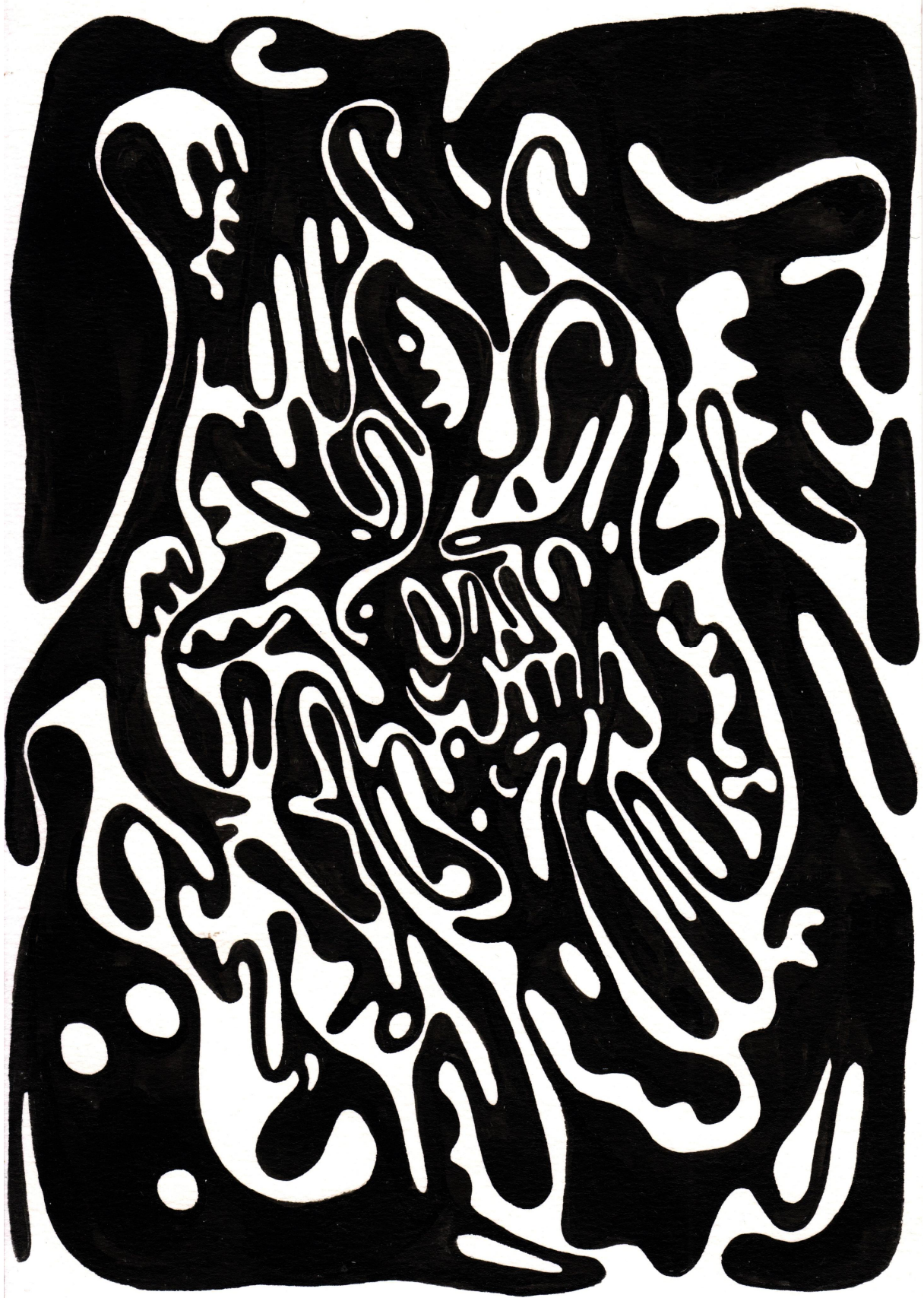
blume (michael johann bauer): hexensabbat.