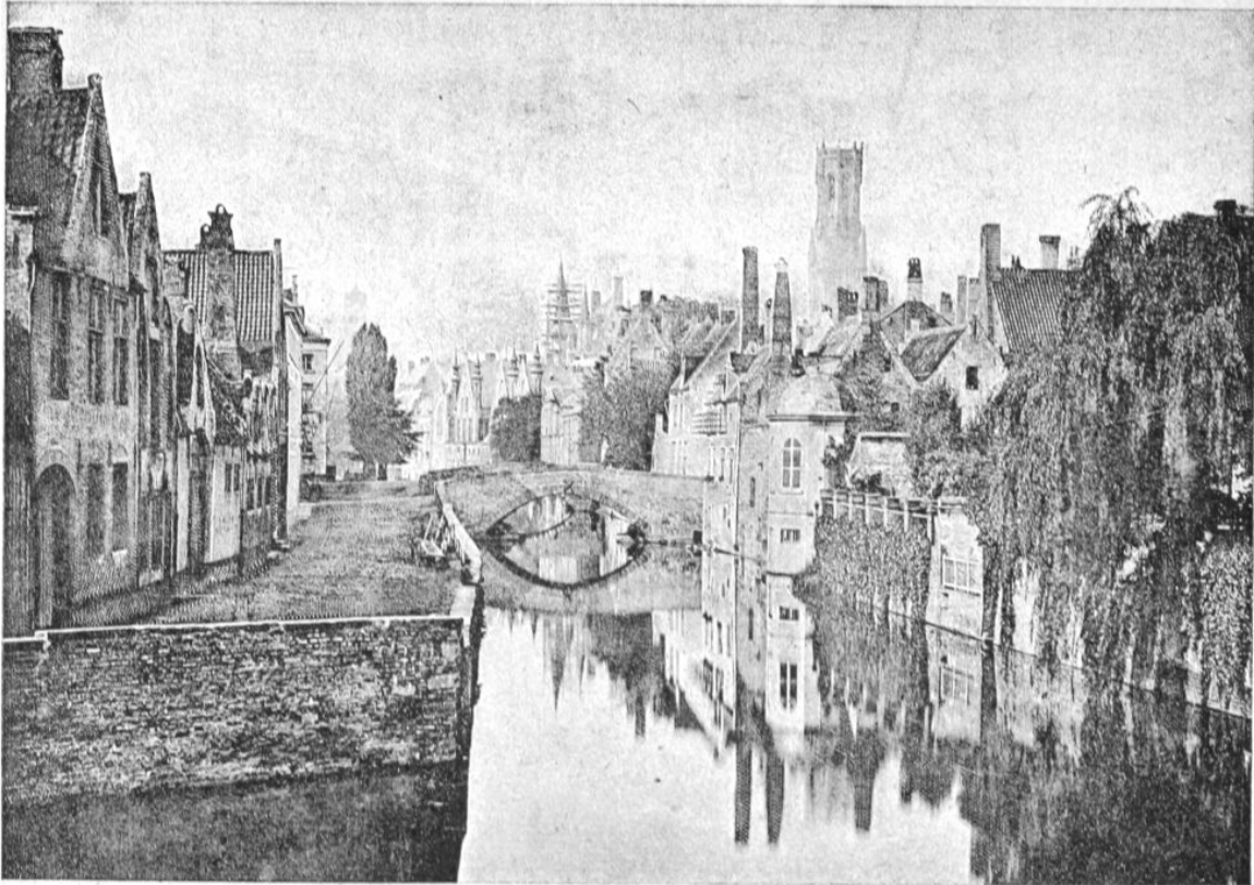
Der Groene Rei bzw. Quai Vert in Brügge Ende des 19. Jahrhunderts: Fotografie aus der Erstausgabe von Rodenbachs Bruges-la-Morte (1892).

war am Ende des Horizontes verschwunden, so fern! Was hatte sie an sich, diese Frau, dass er regelrecht an ihr hing und dass sie ihn der ganzen Welt beraubt hatte, seit sie nicht mehr da war. Es gibt also eine Liebe, die wie Früchte aus dem Toten Meer einen unauslöschlichen Nachgeschmack von Asche im Mund zurücklässt.