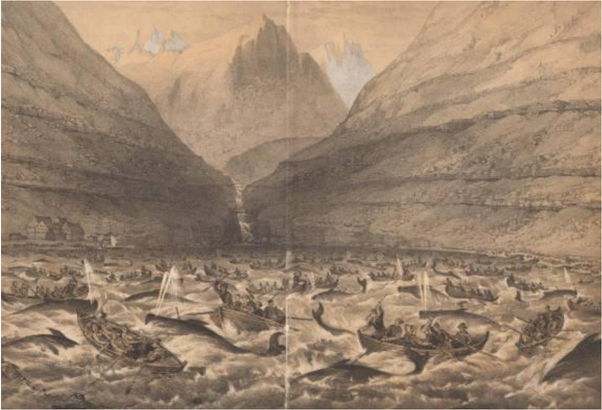
Grindwaljagd im Jahr 1854 (Lithographie zum Expeditionsbericht über die Fahrt der britischen Yacht „Maria“ zu den Färöern, erschienen 1855).

trockenem Brot besteht, wir haben gelernt, mehr zu fordern. Ihr konntet nichts fordern. Und Ihr habt es auch nicht gewagt. Jedes Mal, wenn Ihr den Kopf ein wenig heben wolltet, habt Ihr gleich geglaubt, dass Gott euch [!] zürnen und der Teufel sich die Hände reiben würde.“ (S. 101)