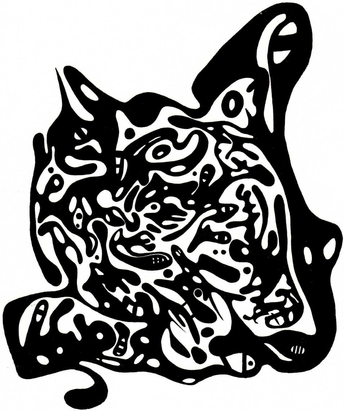
blume (michael johann bauer): portrait eines abstrakten tigers.