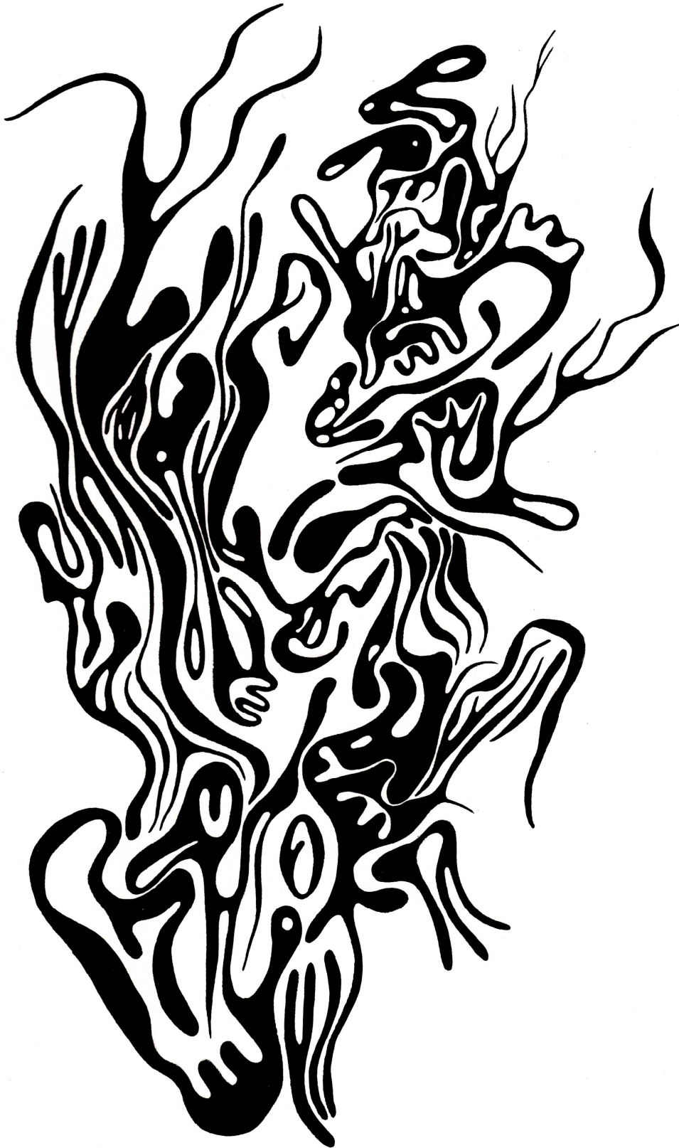
blume (michael johann bauer): zur zustands=beschreibung.