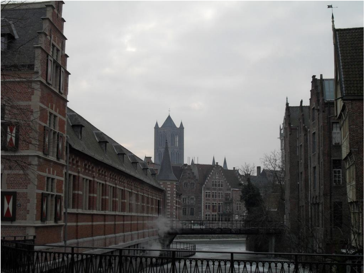
Gent, Blick auf Sint-Niklaas.