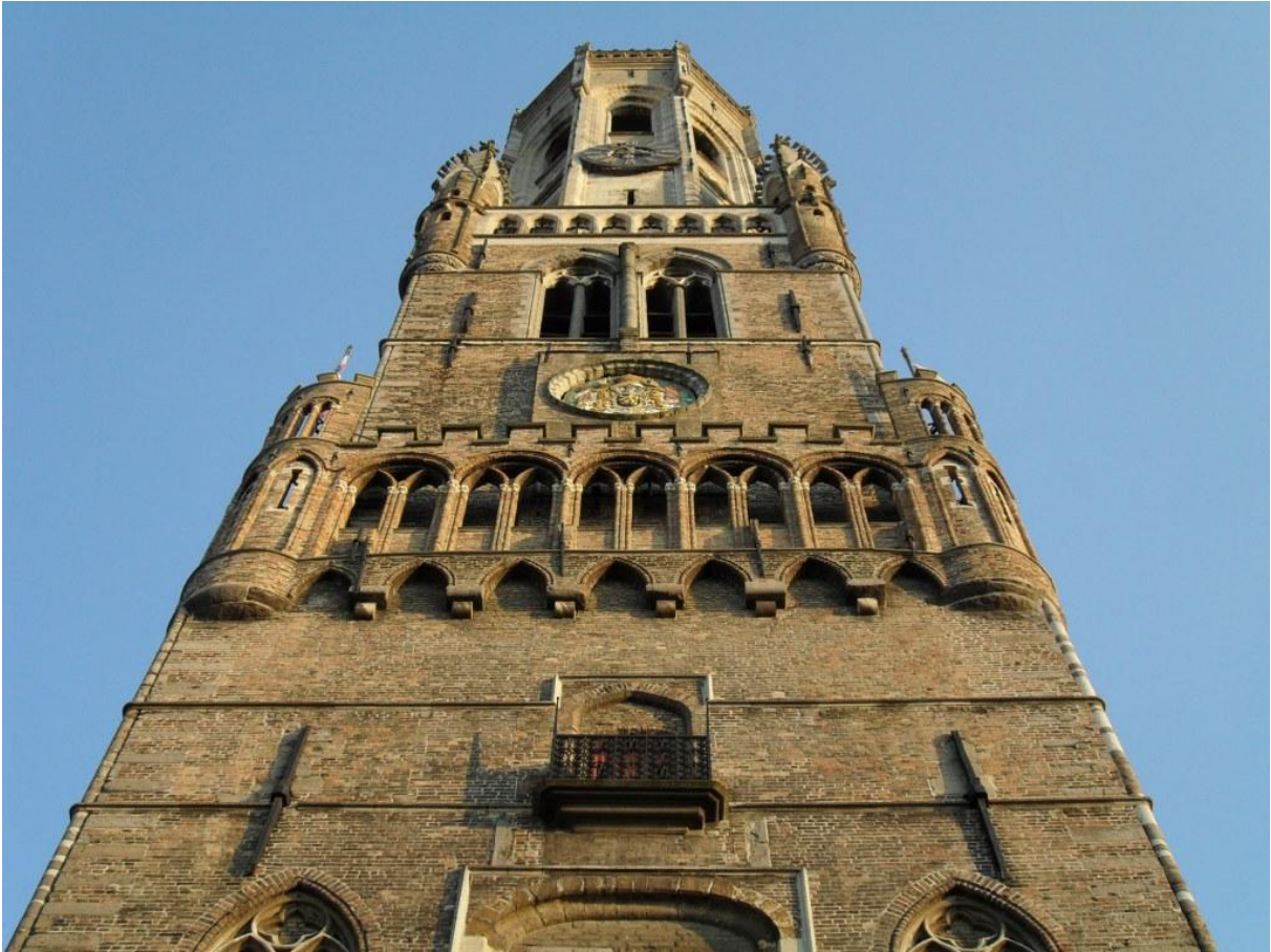
Der Belfried in Brügge.

und Aalst bis Mechelen. Irgendwie hermetisch und eine Art flämischer Stadtanzeiger in einem juristischen Sinne, Stapelrecht inklusive. Das Strukturgerüst der Städte, mit Ausnahme von Antwerpen, dem Generalhafen Flanderns, relativ identisch: ein ringförmiges Zentrum in radialer Ausbreitung zum Rand, erschlossen durch Grachten, in einer steten Abwechslung von Lagerhäusern, Tuchhallen, Börsen, den Rats- und Gesindestuben, Marktplätzen und den vielzähligen Kirchen. Das ist die flandrische Struktur. Perfekt funktional für jeden Strukturwandel, für jedes Jazz-Festival, für jeden Blumenfreund oder Gourmet und für den geliebt gelebten Einzelhandel. Hinter jeder ehrwürdigen Fassade schlummern Antiquitäten und durch-designte Interieurs, hinter jedem bleiglasigen Sprossenfenster lauert ein Jan van Eyck, ein Van Dyck oder Nachfolger oder grandioser Fälscher, während Bier, Sahne, Pommes, Waffeln, Pudelfrisuren und Spitzendecken die öffentlichen Räume beherrschen. Diese aber, mit Ausnahme Brüssels, selten von Epochen, die nicht mittelalterlich sind, beherrscht.