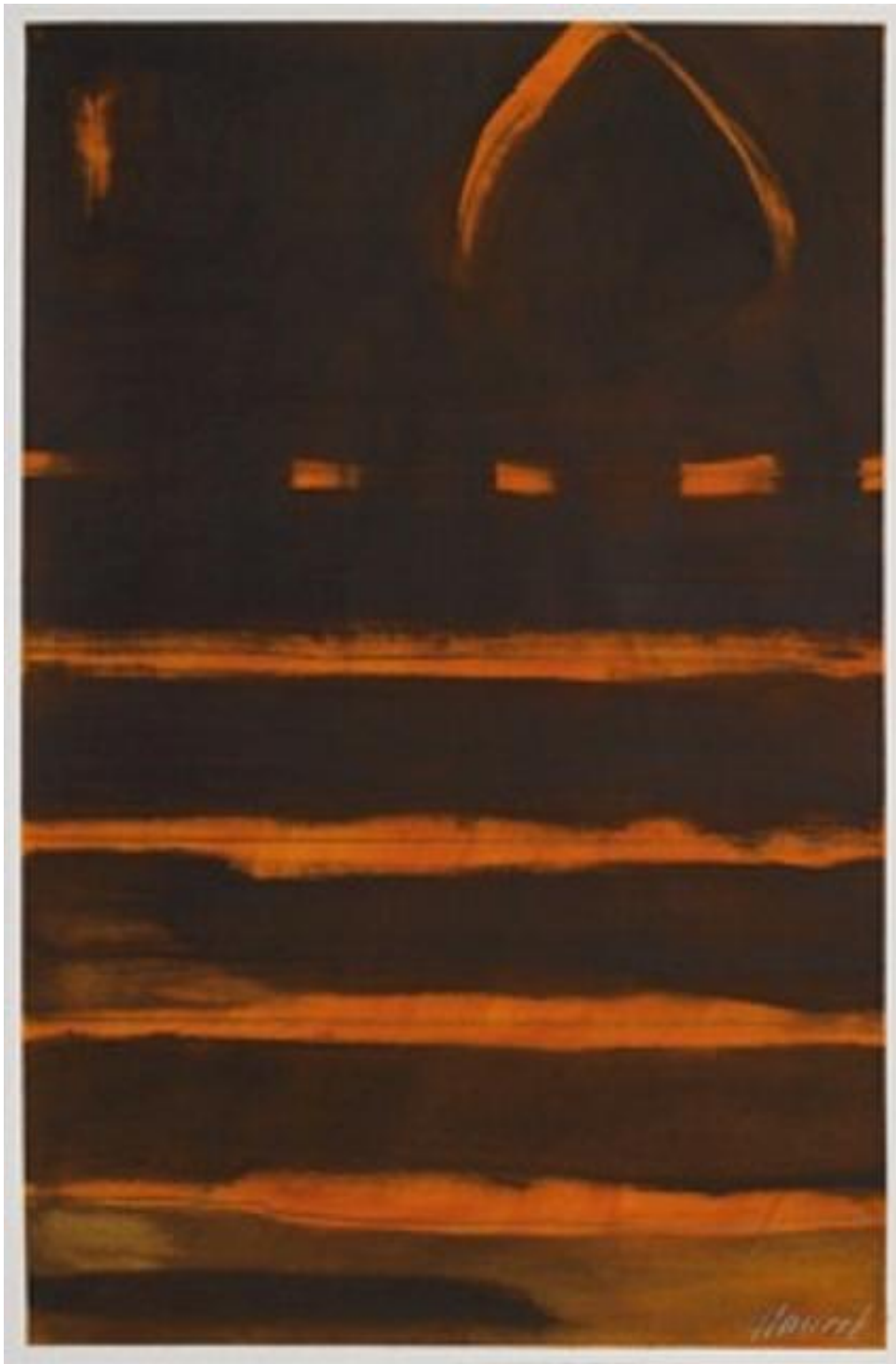
Uwe Harreck: ohne Titel (2012).