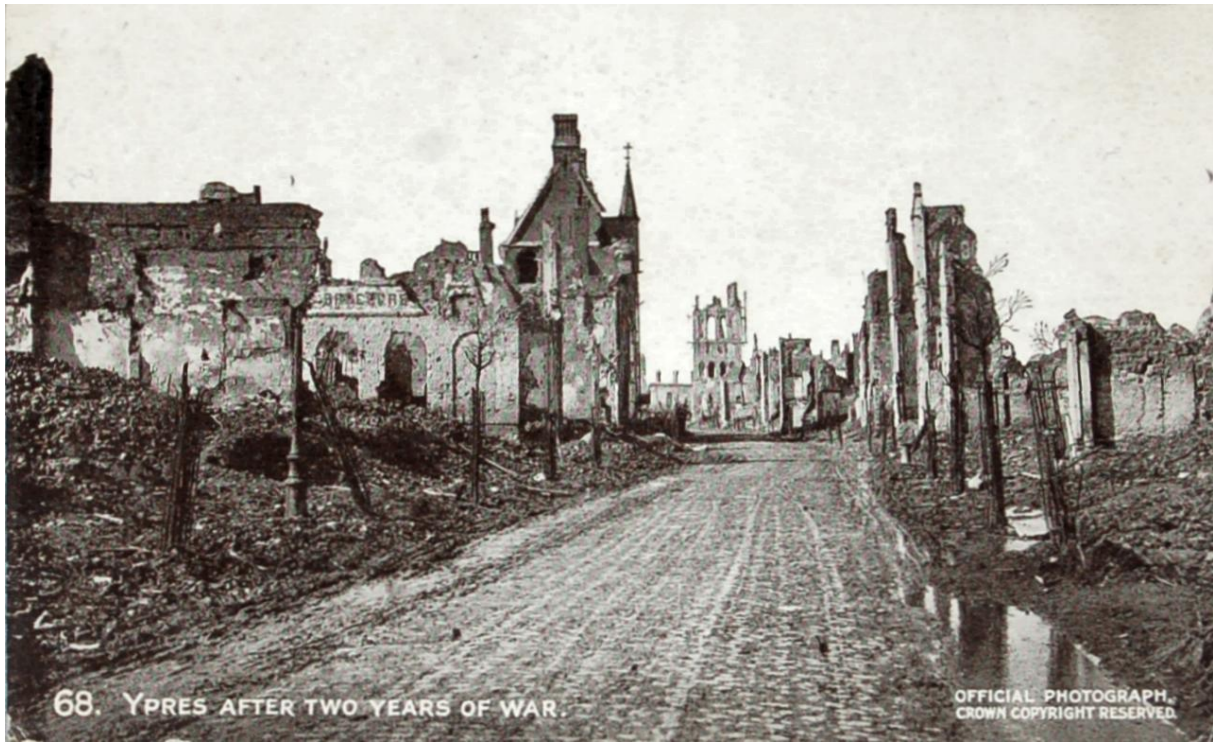
Britische Postkarte von 1916 (World War I Daily Mail Official War Photograph, Series IX, No. 68).